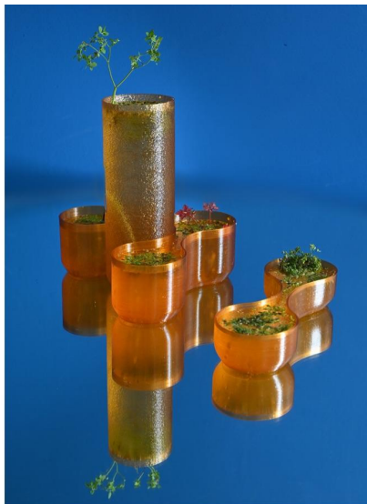
Seaweed Cycle, Balancing Landscape series.