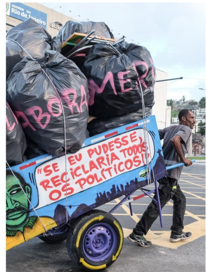
Pimp My Carroça.

Gezamenlijk dienen deze ideeën als hoogstnoodzakelijke wegwijzers voor de nieuwe economie. Stuk voor stuk zijn ze zowel een reden om optimistisch te zijn, als een dringende oproep tot actie. Design filosoof Alice Rawsthorn stelt: ‘Dit is het moment om niet alleen dingen bij te stellen, maar om tegelijkertijd na te denken over hoe onze wereld opnieuw ontworpen moet worden.’