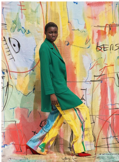
The Slum Studio.